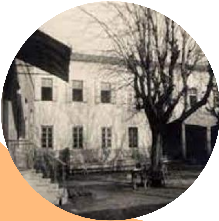
Kinderbewahranstalt von innen 1926