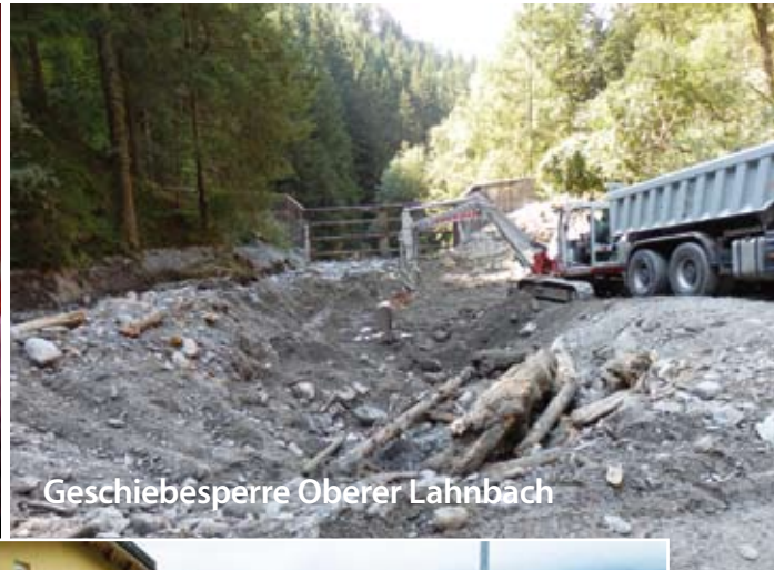
Geschiebesperre Oberer Lahnbach

Bei der nächsten Einsatzbesprechung am Montag, dem 15. August 2011 um 11 Uhr konnte der Bürgermeister berichten, dass insgesamt mehr als 200 Feuerwehrmänner und weitere Kräfte verbundener Organe im Einsatz waren. 85 Kräfte waren während des Feiertags am 15.8. tätig. DI Sauermoser von der Wildbach- und Lawinenverbauung nahm am Nachmittag des 15. August 2011 eine erste Befundung vor, bereits am Abend - bei der nächsten Einsatzleiterbesprechung um 18 Uhr - lag ein erstes Grobkonzept für die erforderlichen Maßnahmen vor. HR Sauermoser schlug die Errichtung eines Projektes mit einem Sofortprogramm zur Wiederherstellung der Straße und aller Einläufe und der Sicherung für künftige Unwetter im Bereich des Fetzlgrabens vor. Kosten geschätzt 300.000,- Euro. Der Bürgermeister beauftragte die sofortige Umsetzung.