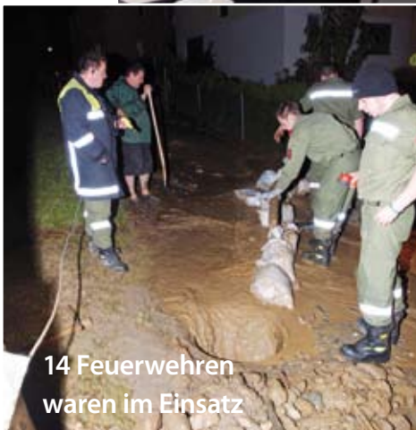
14 Feuerwehren waren im Einsatz