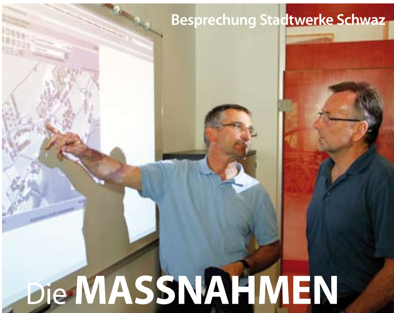
Besprechung Stadtwerke Schwaz