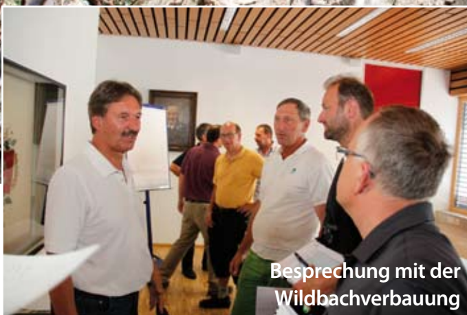
Besprechung mit der Wildbachverbauung

Insgesamt war die FF Schwaz 1.031 Stunden und mit 26 Fahrzeugen im Einsatz. Zu Hilfe eilten die Betriebsfeuerwehr Tyrolit mit 109 Stunden, die Feuerwehren aus Jenbach mit 146 Stunden, Zell a. Ziller mit 119 Stunden, Buch mit 121 Stunden, Vomp mit 113 Stunden sowie die Feuerwehren aus Pill, Stans, Strass, Schlitters, Kaltenbach, Ried, Schwendau, Ramsau, Mayrhofen sowie Hall und Innsbruck . Insgesamt waren die Feuerwehren aus der Region 995 Stunden im Einsatz mit 35 Fahrzeugen und die Bergrettung 273 Stunden mit 34 Einsatzkräften. 365 Hilfskräfte verhinderten mit 2.289 Stunden und 67 Fahrzeugen noch Schlimmeres und halfen, das Wasser und die Vermurungen so schnell als möglich wieder zu beseitigen sowie die Straßenverbindungen wieder zu öffnen.