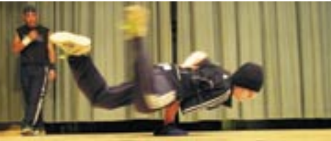
Im Jugendzentrum Schwaz hat sich eine starke Breakdancegruppe entwickelt.

Das Jugendzentrum X-Dream befindet sich derzeit in der Pölbühne Schwaz. Im neuen Jugendzentrum im Gebäude des Interspar in Schwaz-Ost werden große und modern ausgestattete Räumlichkeiten zur Verfügung stehen. Das Schwazer Jugendzentrum erhält damit einen optimalen Standort im „jüngsten“ und bevölkerungsreichsten Ortsteil von Schwaz. Öffnungszeiten und Angebote sind im Jugendzentrum angeschlagen.