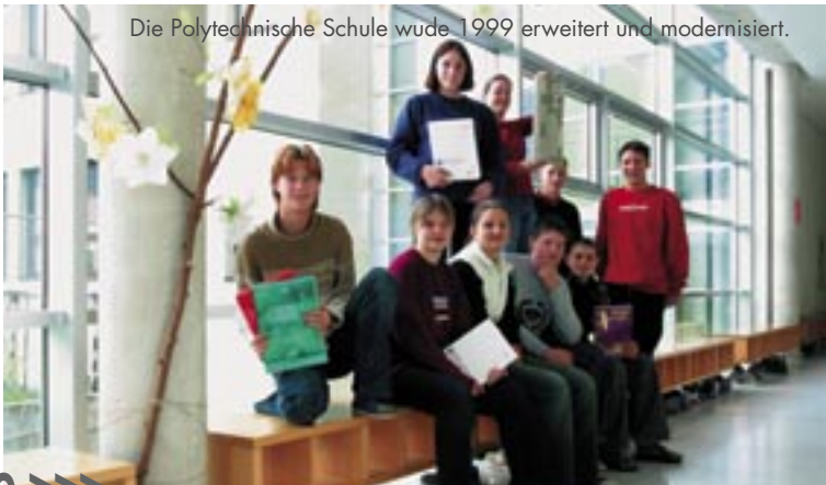
Die Polytechnische Schule wurde 1999 erweitert und modernisiert.

Schule ist nicht alles im Leben eines Jugendlichen, aber eine gute Schulausbildung öffnet für alle das Tor in eine zufriedenstellende Zukunft mit einem interessanten Beruf.