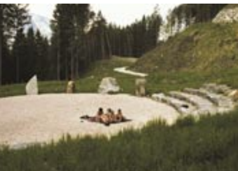
.... einfach einmal so zum Relaxen.

Jedes Jahr wird ein neues Stück Erlebnisraum geschaffen. Im Jahr 2002 wurde zum Beispiel das Projekt „Silberwald“ gestartet, das zu einem richtigen Silberwald heranwachsen wird.