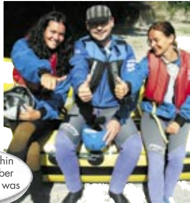
Auch Ausflüge stehen am Programm.