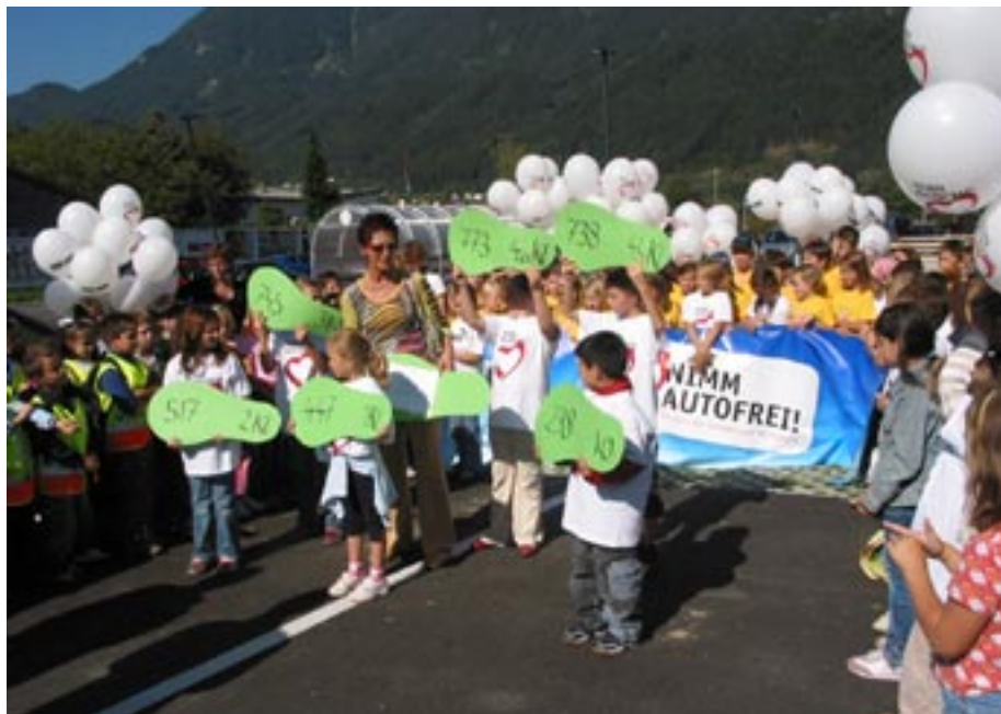
Die Johannes-Messner-Volksschulen haben zum Autofreien Tag wieder ganz viele grüne Meilen gesammelt in Form von Wegen, die die Kinder zu Fuß, mit dem Fahrrad oder Bus zurücklegen.