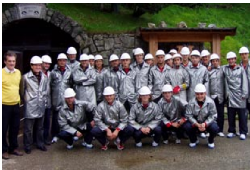
Die österreichische Nationalmannschaft verbrachte 10 Trainingstage in Schwaz und besuchte u.a. auch das Schaubergwerk.