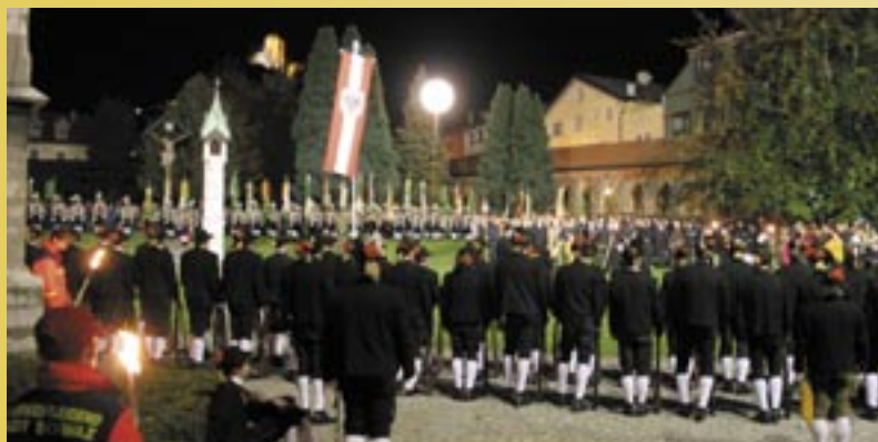
Krönender Abschluss der Schwazer Kulturmeile wird auch heuer ein feierlicher Zapfenstreich im Stadtpark sein.