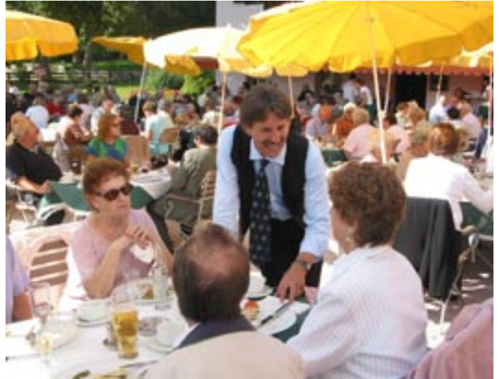
Der Bürgermeisterausflug führte heuer zum Speckbacherhof.