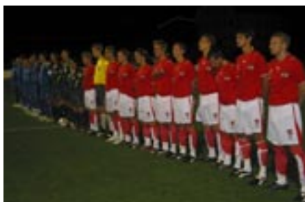
Am 3. Oktober besiegte die österreichische U21-Nationalmannschaft den amtierenden U21-Weltmeister Italien in Schwaz 4:2.

Am Sonntag, dem 1. Oktober 2006 feierte der SC-VW PICKER SCHWAZ gegen Absam das 7000. Meisterschaftsspiel seiner 85-jährigen Vereinsgeschichte. Rechtzeitig zum Jubiläum ist es dem Verein auch gelungen, ein tolles Event nach Schwaz zu holen: Am 3. Oktober spielte erstmals eine U 21 Nationalmannschaft in Tirol - und das gegen den amtierenden U 21 Weltmeister Italien. Der Star der Squadra Azzurra ist derzeit unbestritten Trainer Pierluigi Casiraghi. Der ehemalige Starstürmer von Juventus, Lazio und Chelsea schwingt seit August 2006 das Zepter bei den jungen Azzurri. Und die Sensation war perfekt, als es dem österreichischen U21-Nationalteam gelang, die italienische U21 mit 4:2 vom Platz zu schicken.