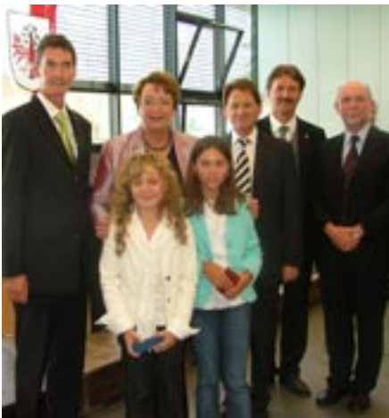
Ministerin Elisabeth Gehrler mit den Direktoren, Bürgermeister und Moderatorinnen.

SchülerInnen von BORG und HAK sorgten mit großem Können für die passende musikalische Umrahmung.