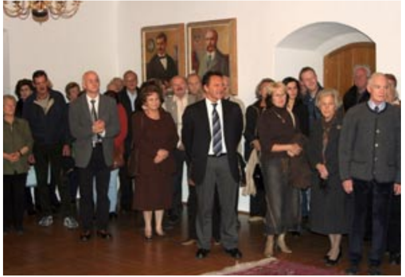
Die Seniorenkulturtage 2006 finden vom 16. bis 18. November im Rathaus statt.