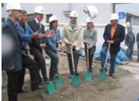
Die Freude beim Spatenstich für das Jugendzentrum und Musikschule war groß.