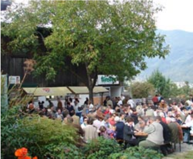
Das Hoffest beim Marterer-Bauern zog an die 1.000 Besucher an.