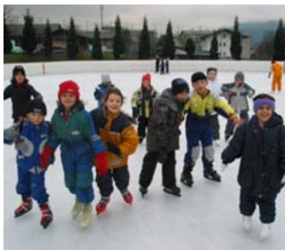
Ab Anfang November herrscht in Schwaz am Eislaufplatz wieder "Eiszeit" – ein lustiges und gesundes Vergnügen für die ganze Familie und natürlich alle „Eissportler“.