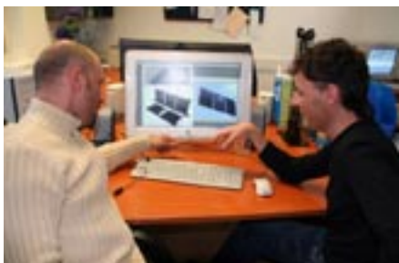
Die neue Generation von Solarzellen kommt auch aus Schwaz.