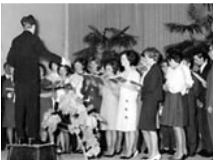
Chorkonzert des Musikkollegiums im Hotel Post am 15. Juni 1963.