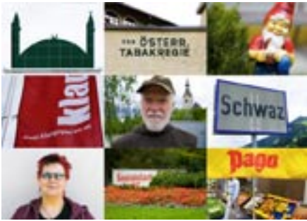
70 Bilder aus Schwaz, Robert Fleischanderl.