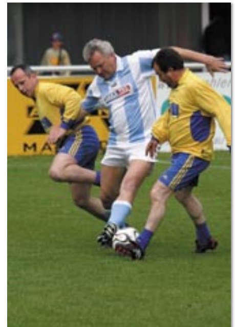
Die „Altherren“ beim Partnerstadt-Pfingstturnier zeigten sich gut in Schuss.