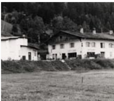
Das Liftcafé wie es früher war.