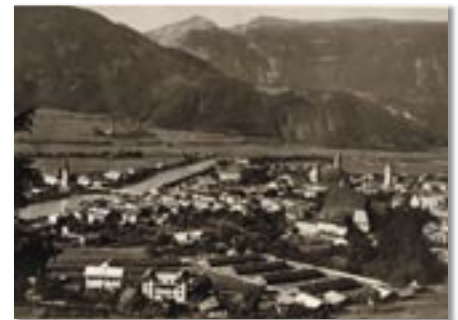
Blick vom Pirchinger.