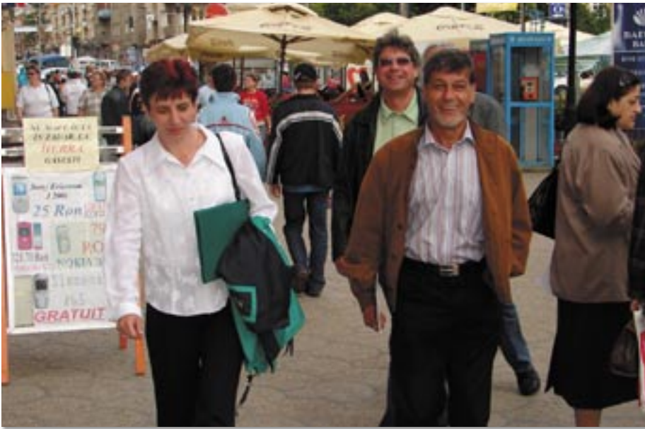
Am 26. Mai 2006 wurde bei einem Besuch der Partnerschaftsvertrag mit Satu Mare in Rumänien unterzeichnet.