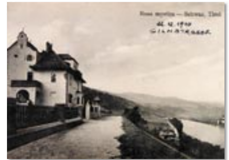
Egerdach, Gilmlstraße 1940.