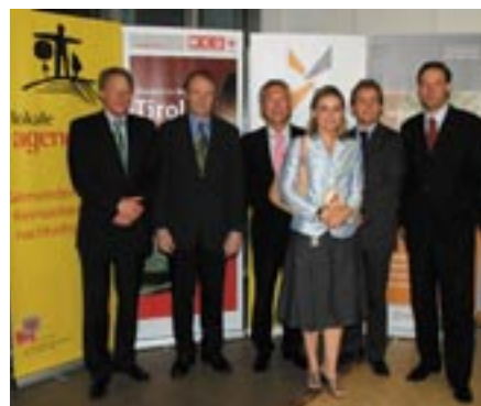
Im Mai 2006 wurden Tyrolit und neun weitere Tiroler Betriebe für nachhaltiges Wirtschaften ausgezeichnet.

Am 18. Mai 2006 wurden zehn Betriebe vorgestellt, die sich erfolgreich dem „Auditverfahren Nachhaltigkeitscheck“ unterzogen, darunter auch als einziges Schwazer Unternehmen Tyrolit.