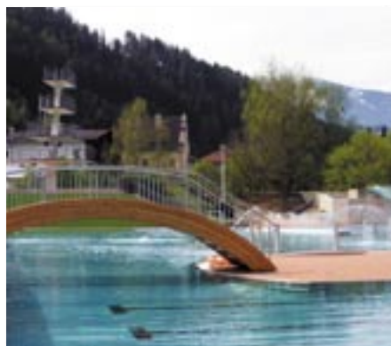
Das Schwimmbad in Schwaz heute und im Jahr 1964.