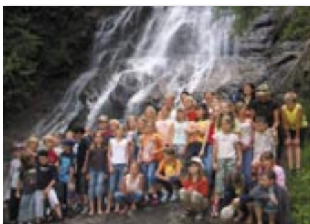
Das SPZ Schwaz besuchte im Juni die VS Hart.

ten "Herbstferien" an. Die Bundesschulen (Gymnasien) sowie die Polytechnische Schule beginnen das neue Schuljahr am Montag 11. September. Für weitere Informationen sind die Direktionen spätestens 1 Woche vor Schulanfang erreichbar. Weitere Kontaktmöglichkeiten (auch zu den Bundesschulen, zur Musikschule, zur Berufsschule und zur Volkshochschule) finden Sie unter www.schwaz.at .