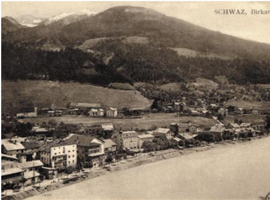
Die bestimmende Kraft des Ortsteiles Einöde war der Inn, der bis zur Verbauung sein Bett noch viel näher an die Häuser geschmiegt hatte.