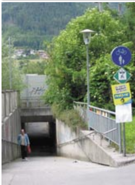
Die „Grünen Achsen“ kennzeichnen die besten Verbindungen für Radfahrer.