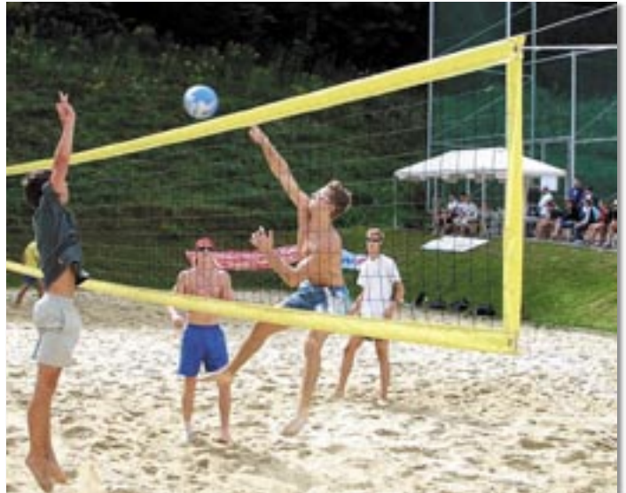
Am 13. August findet in Schwaz ein Beachvolleyballturnier für Jugendliche statt. Anmeldung unter grunzis@utanet.at.