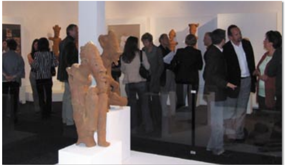
Am 19. Mai eröffnete das Haus der Völker eine seiner bisher bedeutendsten Sonderausstellungen.