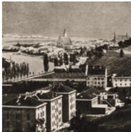
Das Paulinum in Schwaz wurde im Jahr 1926 errichtet. Zum 80-Jahr-Jubiläum wurde es grundlegend modernisiert. www.paulinum.ac.at .

Es gibt „live“ noch Zeugen oft längst vergangener Ereignisse zu entdecken. Alte Ansichten von Schwaz sind auch unter www.6130.info zu finden.