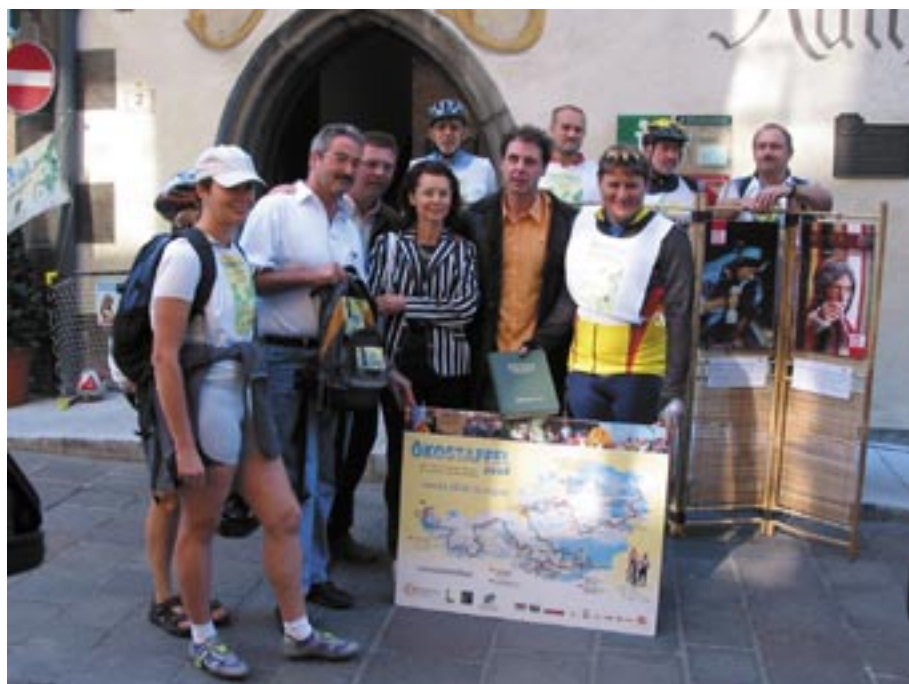
Am 10. und 11. Juli macht die Ökostaffel 2006 Station in Schwaz.