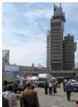
Satu Mare ist die zweitgrößte Stadt in Rumänien mit einem historischen und einem modernen Teil.

Caritas und Kiwanis haben bereits enge Kontakte. Nächstes Ziel ist, die Freundschaft zu vertiefen und Kontakte zu vereinfachen. Es soll ein weiteres „EU-Projekt Kiwanis“ in Zusammenarbeit mit der Caritas durchgeführt werden und ein integrativer Kindergarten sowie ein Kinderspielplatz nach europäischen Standards errichtet werden.