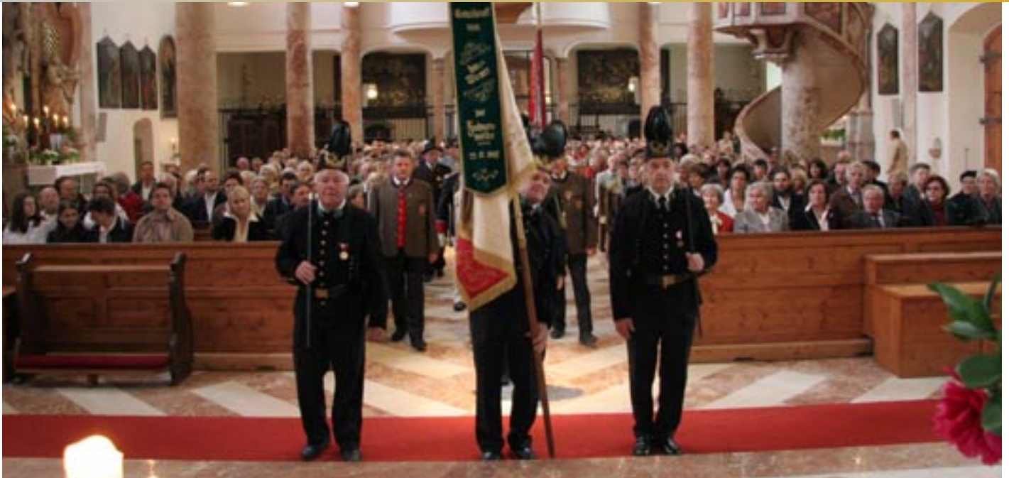
Mit der Krönungsmesse von Mozart eröffnete das Musikkollegiums Schwaz den Silbersommer 2006.

Nichts Schöneres kann den Kulturmachern geschehen, als voll besetzte Veranstaltungen und begeistertes Publikum.