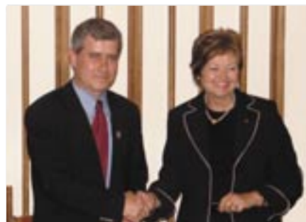
Der Partnerschaftsvertrag wurde besiegelt.

Bildung. Es wurden die Strukturen und Arbeitsweisen der schulischen Ausbildung, Methoden und Schulungsarbeit im Bereich „Sprachliche Schulung, Fremdsprachen erklärt und verglichen. Realistisch erscheint ein temporärer Lehreraustausch und Möglichkeiten zu schaffen für Sonderbegabte. Auch sollen laufender Austausch und Information über interessante Schulprojekte erfolgen.