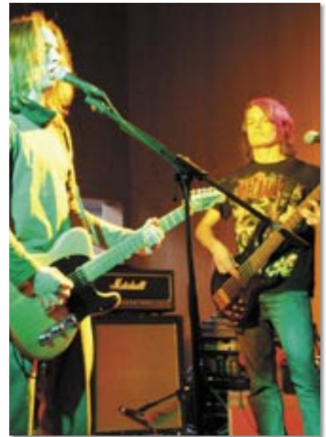
Nach Silversound und Silversession folgt am 7. Juli eine große Schulschlussparty.