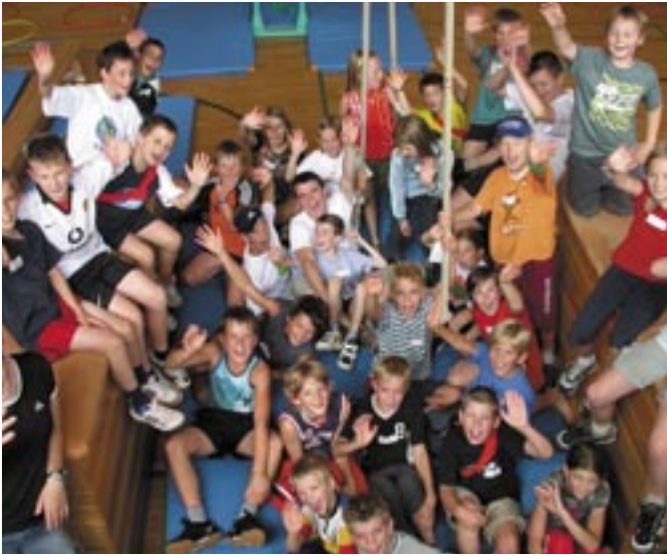
Sport, Spiel und Spaß bietet die Ferien-Sportwoche des Vereins Gesünder Leben auch heuer im Sommer.