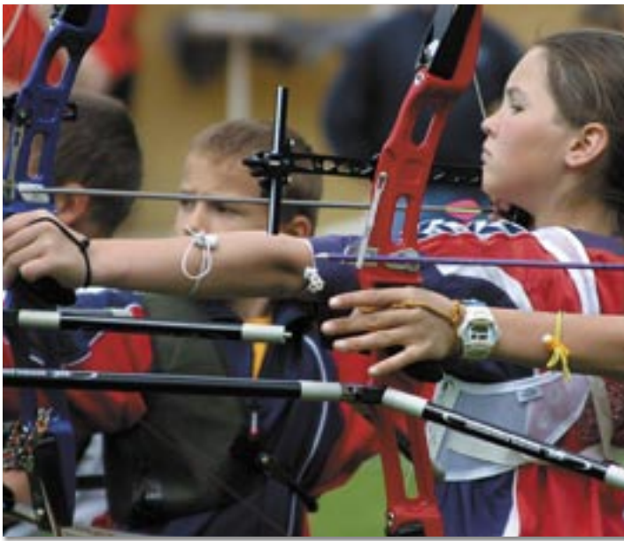
Am 13. August schießen die Bogenschützen beim Fita-Stern-Turnier um die Silberhämmer von Schwaz.