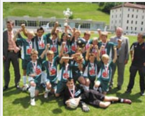
Die Schülerliga-Sieger 2006 aus Schwaz.

Anmeldeschluss ist Samstag 12. August 2006. Turnier: Sonntag, 13. August 2006, ab 9 Uhr, Qualifikation: Samstag, 6. August 2005, 14 Uhr, Beachplätze im Regionalen Sportzentrum. Nenngeld 5,- Euro pro SpielerIn (inkl. freiem Eintritt ins Schwazer Freibad). Veranstalter ist die Turnerschaft Sparkasse Schwaz, Beachvolleyball. Anmeldung per mail unter grunzis@utanet.at oder telefonisch unter 0650/9009447 (Herbert Gründhammer). Die Anmeldung ist gültig, wenn das Nenngeld eingezahlt ist, Konto-Nr. 10363 Sparkasse Schwaz BLZ 20510.