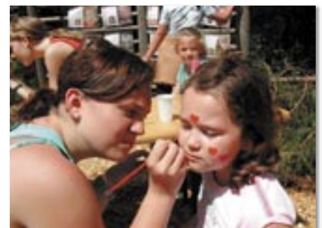
Beim Spielefest im Pflanzgarten.

Am 17. Juni fand bei unerwartet schönem Wetter das Spielefest im Pflanzgarten statt. Zahlreiche Spielstationen sorgten für Unterhaltung, aber auch für Herausforderung an die Kreativität und Geschicklichkeit der jungen Gäste und deren Eltern. Für Kulinarisches war bestens gesorgt und so genossen die Familien den schönen Nachmittag, denn noch eine Stunde vor Festbeginn hatte es heftig geregnet. Ein Dank gilt all den engagierten jungen HelferInnen, die das Fest möglich gemacht haben.