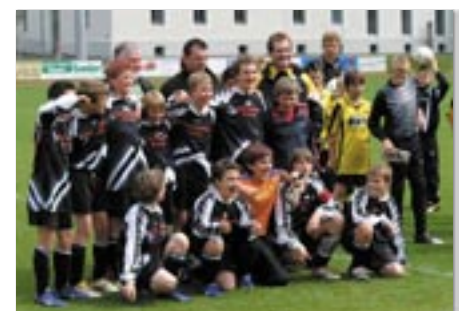
Die U11 Mindelheim beim Pfingstturnier.

Zu Pfingsten veranstaltete der SC VW Picker Schwaz erstmals ein großes Partnerstädte-Turnier im Regionalen Sportzentrum Schwaz. Es wurde in 3 Altersgruppen gespielt. Beim U11 Turnier gingen 4 Mannschaften an den Start, Bourg de Peage, die U10, die U11 und die U12 des SC VW Picker Schwaz. Beim U13 Turnier gab es 6 Teilnehmer: Bourg de Peage, Mindelheim, Trient, Tramin. Und auch die „alten Herrn“ zeigten beim Partnerstadt-Turnier, dass sie noch in Schuss sind. Beim Ü40 Turnier kämpften 4 Teams um den Sieg, Bourg de Peage, Trient, Mindelheim und SC Schwaz. Die Gäste aus den Partnerstädten wohnen zum Teil in der neuen Jugendherberge und fühlten sich dort sehr wohl.