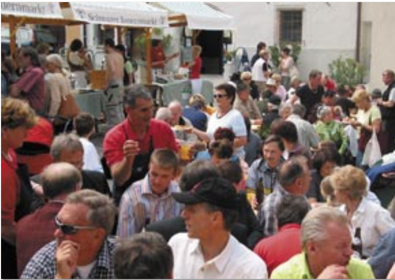
Am 10. Juni 2006 feierte der Bauernmarkt in Schwaz 20-jähriges Jubiläum. Mit vielen Köstlichkeiten der Region und vielen BesucherInnen.