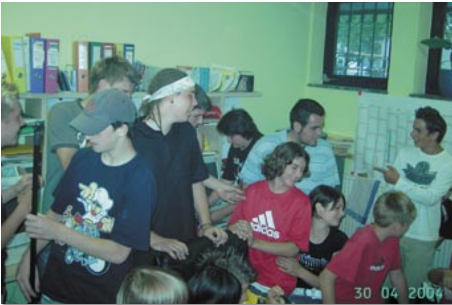
Am 12. Juni 2006 feierte Streetwork Schwaz unter reger Beteiligung das 5-Jahres-Jubiläum.