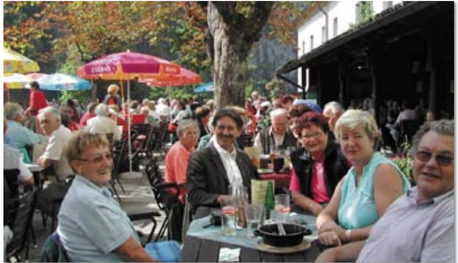
Am 15. September sind wieder alle Schwazer Seniorinnen und Senioren herzlich eingeladen, an Wandertag und Wallfahrt nach St. Georgenberg teilzunehmen.