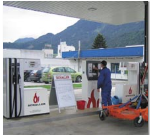
Die neue moderne Tankstelle der Firma Schaller im Gewerbegebiet Einfang.