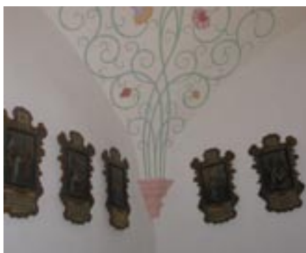
In der Kapelle im 2. Stock des Rathauses sind seit Kurzem die Kreuzwegstationen von Christoph Anton Mayr zu sehen.