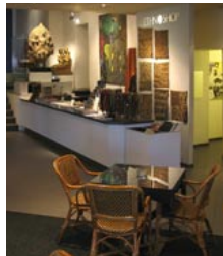
Markt der Völker im Haus der Völker.