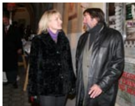
Künstler und Kulturreferentin vor der Gedenktafel im Schwazer Stadtpark.