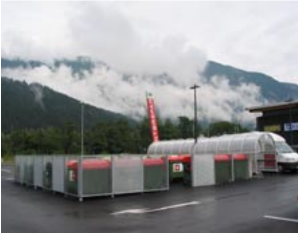
Wertstoffsammelstelle am Interspar-Parkplatz.