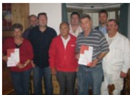
Speziell geschulte ErsthelferInnen.

10 MitarbeiterInnen der Stadtgemeinde Schwaz absolvierten vor Kurzem den 16-stündigen Erste-Hilfe-Lehrgang beim Roten Kreuz Schwaz, u.a. erlernten sie auch den Umgang mit einem Defibrillator. Mit Ende des Jahres werden insgesamt 31 MitarbeiterInnen der Stadtgemeinde im Rathaus, im Schwimmbad und in den Schulen und Kindergärten eine besondere Ersthelfer-Ausbildung absolviert haben.