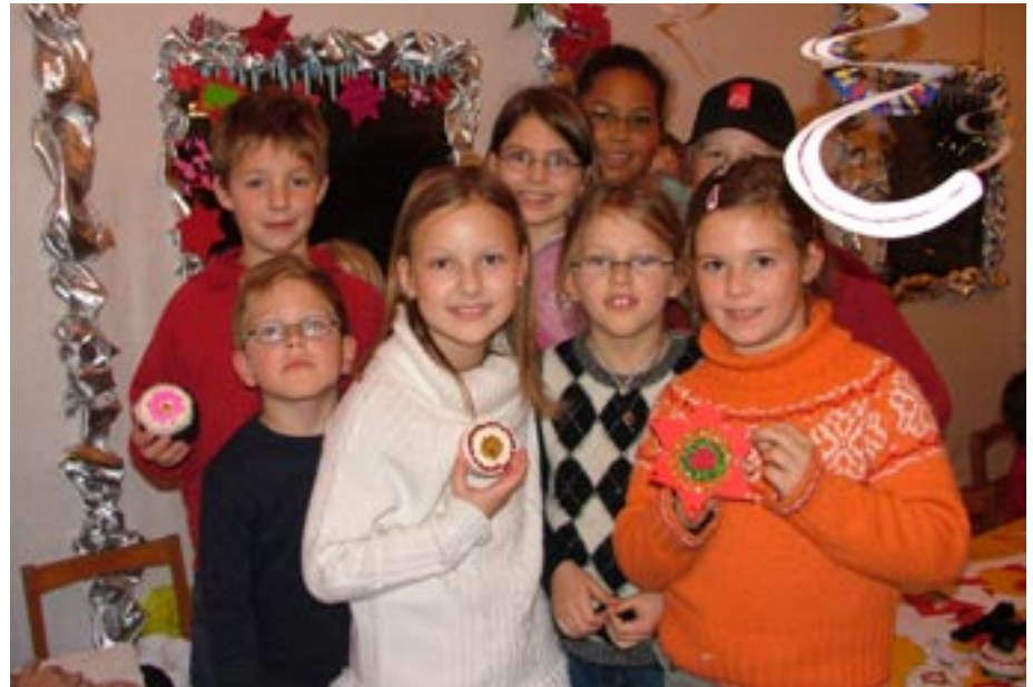
Die Christkindlwerkstatt am Adventmarkt ist jeden Freitag, Samstag und Sonntag geöffnet.