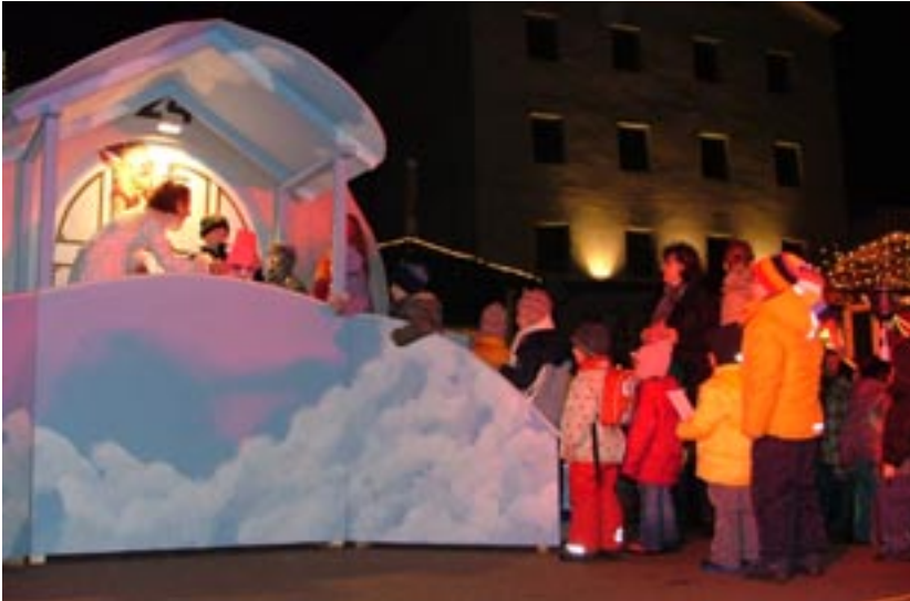
Am 16. Dezember holt am Adventmarkt der Engel Avelina die Christkindbriefe der Kinder persönlich ab.