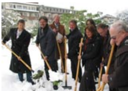
Spatenstich für das „Haus der Generationen“ am Schnapper-Areal.

Die Planungen Neubau Sauna sind abgeschlossen, der Baubeginn steht kurz bevor. Die Planungen Feuerwehr-Zentrale sind voll im Gange. Mit den Spatenstichen Psennerstraße und „Haus der Generationen“ starten zwei weitere Großprojekte in Schwaz.