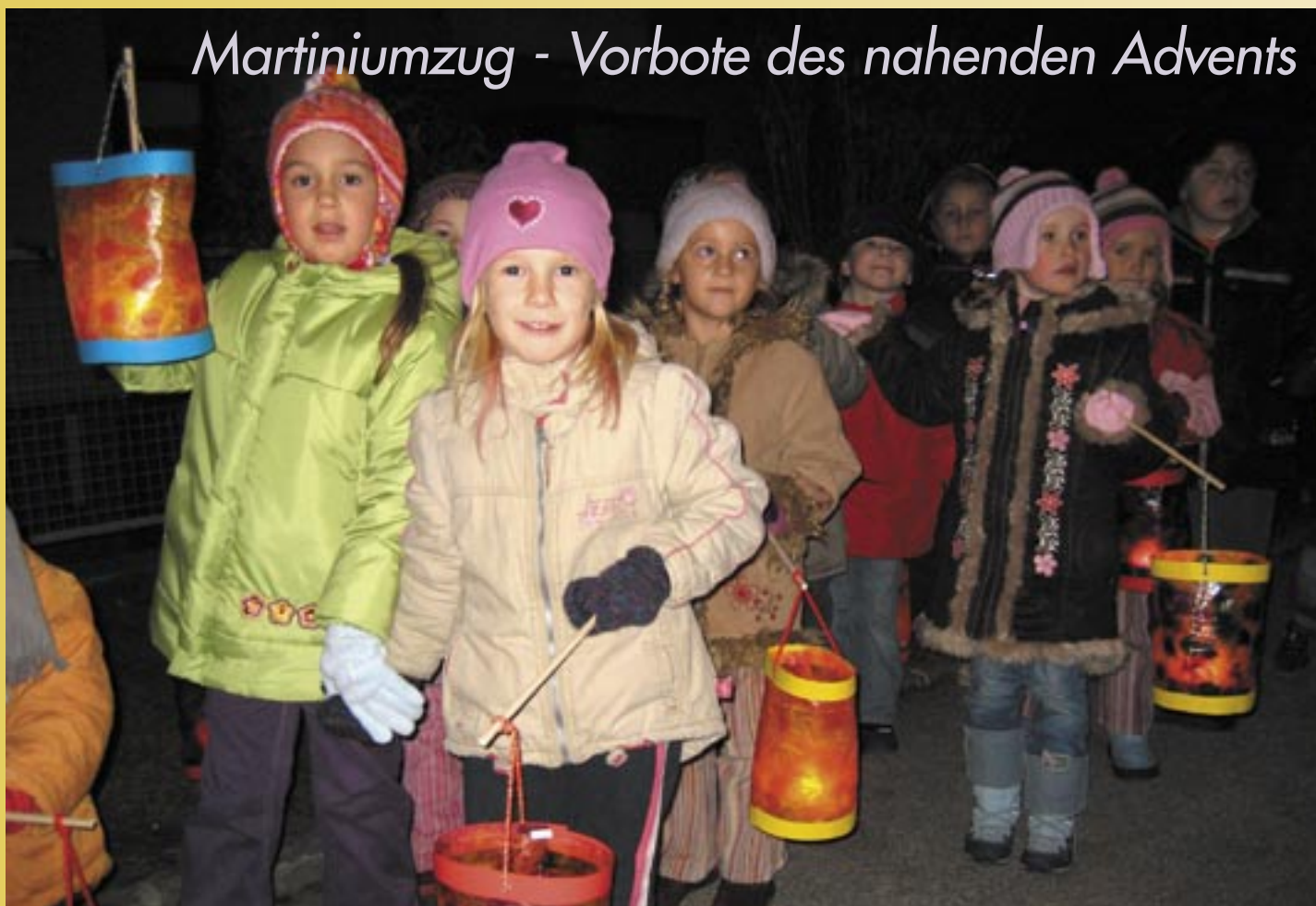
Martiniumzug des Barbara-Kindergartens.