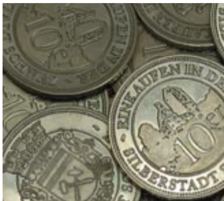
Der Schwazer Silberzehner.

Der Schwazer Silberzehner - die Stadt-währung - ist vor allem ein schönes Weihnachtsgeschenk. Im Programm des Schwazer Adventmarktes sind alle Geschäfte angeführt, in denen mit dem Silberzehner gezahlt werden kann.