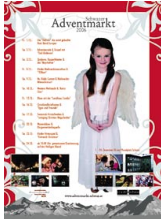
Das Programm des Adventmarktes gibt es als Folder oder unter www.adventmarkt.schwaz.at .