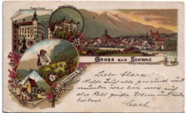
Im Rabalderhaus sind ab 24. Nov. alte Ansichtskarten von Schwaz zu sehen.