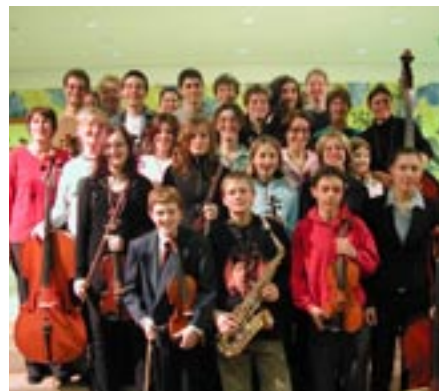
Das Jugendstreichorchester der Musikschule Schwaz.

Mi, 13. Dezember 2006, 19 Uhr, Pölbühne. Es musizieren der Kinderchor und verschiedene Ensembles der LMS Schwaz, stimmungsvolle Musik und Texte zur Weihnachtszeit zaubern adventliche Stimmung. Eintritt frei.