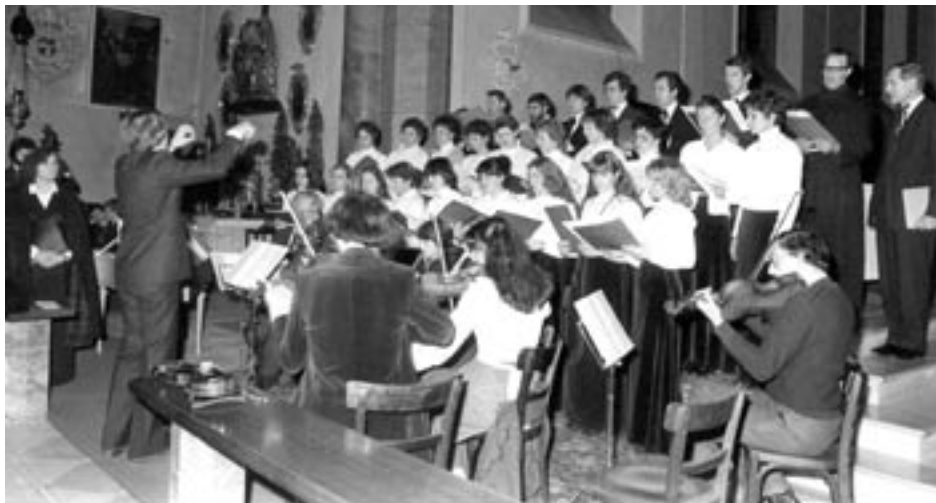
Weihnachtssingen des Musikkollegiums Schwaz 1982.