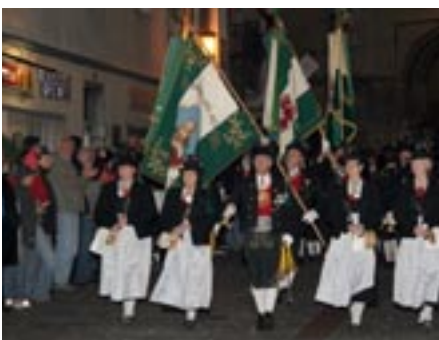
Die Kulturmeile endet traditionellerweise mit dem großen Zapfenstreich.