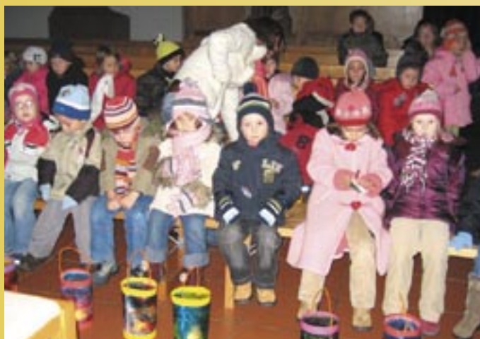
St. Martins-Feier in der Barbarakirche.