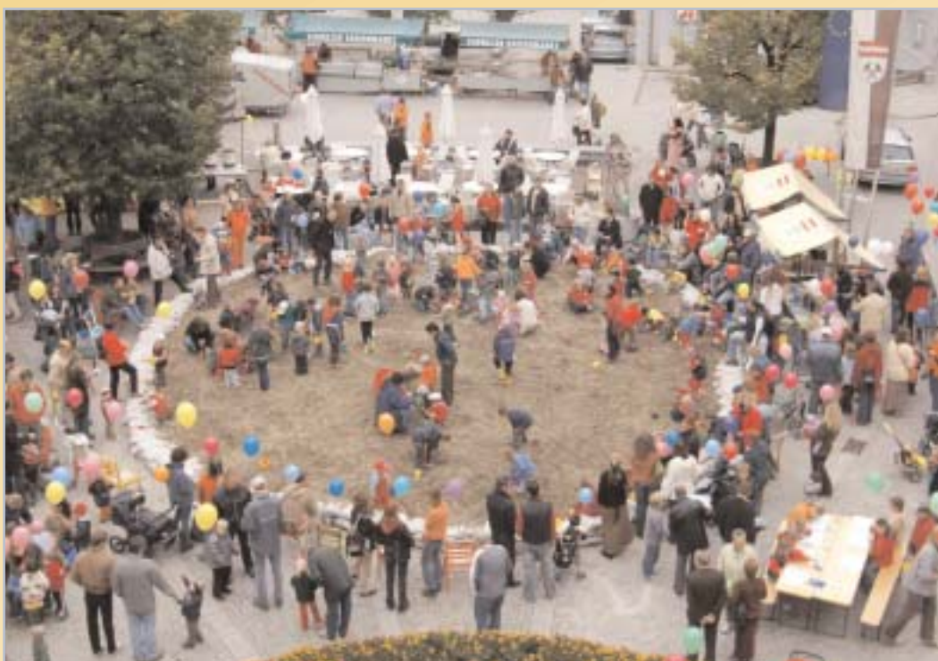
Und viel Spaß hatten die Kinder auch bei der 10-Jahresfeier des Eltern-Kind-Zentrums.