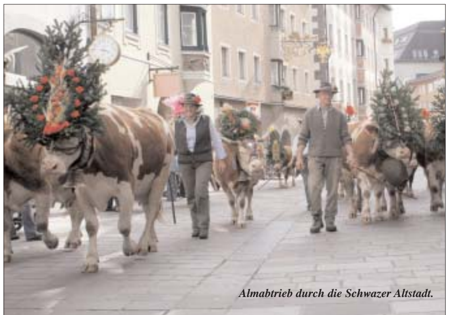
Almabtrieb durch die Schwazer Altstadt.