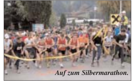
Auf zum Silbermarathon.

Zur Ausstellung des Sportpasses sind folgende Daten/Unterlagen erforderlich: ein aktuelles Foto (2,5 x 3,5 cm), Name, Geburtsdatum, Anschrift. Der Sportpass ist nicht übertragbar und bei Verlangen vorzuweisen.