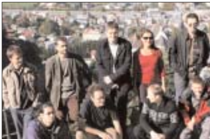
Die Schwazer StadtschreiberInnen.

Mit dem 3-tägigen Lesefest „Lauschangriff“ startete das Schwazer Literaturforum ins 10-Jahres-Jubiläum. Zum Lauschangriff konnten alle bisherigen Schwazer StadtschreiberInnen gewonnen werden. Gleichzeitig wurde damit auch unterstrichen, wie wertvoll es ist, wenn eine Stadt wie Schwaz ein Literaturstipendium vergibt.