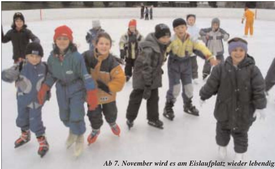
Ab 7. November wird es am Eislaufplatz wieder lebendig.