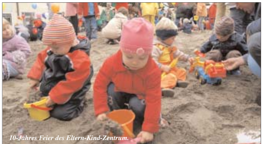
10-Jahres Feier des Eltern-Kind-Zentrum.

Spendenaktion „Paznauner Kinder“ Die Spendenaktion des Eltern-Kind-Zentrums, bei der für Paznauner Kinder