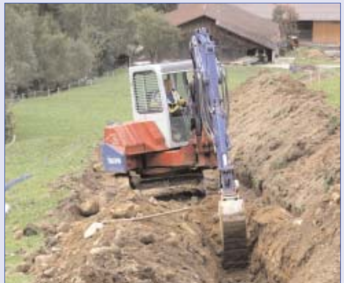
Grabungsarbeiten auf der Schmadlwiese.

Im Baustellenbereich muss mit Behinderungen gerechnet werden. Wir danken für Ihr Verständnis!