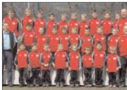
Die U9 des SC Schwaz

„Tut jeder in seinem Kreis das Beste, wird's bald in der Welt auch besser aussehen!“