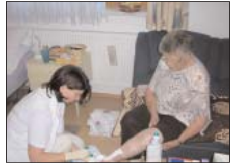
Pflege zu Hause des Gesundheitssprengels.

Am Freitag, 4. November 2005 findet um 20 Uhr in der Pölbühne in Schwaz das nächste Jeunesse-Konzert statt. Das „Calmus Ensemble Leipzig“ präsentiert mit „1.000 Jahre Vokalmusik“ ein gemischtes A-capella-Programm von J.S. Bach bis zu den Beatles. Tickets unter der Ticket-Line 05242-64372 oder tickets@jeunesse.at.