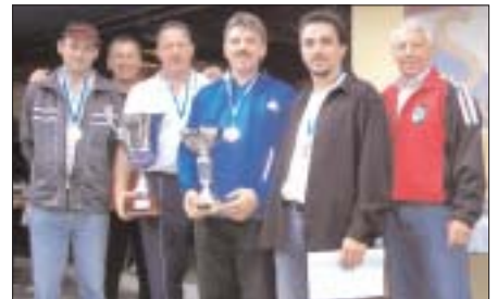
Schwazer Stadtmeisterschaft 2005.

Am 10. September 2005 führte der SC Volksbank Schwaz, Zweigverein Eisschießen die 1. Schwazer Stadtmeisterschaft im Stockschießen für alle in Schwaz gemeldeten Vereine und Sportgemeinschaften durch. Der BSG Tyrolit (Betriebssportgemeinschaft) siegte knap mit 17:15 Stockpunkten, Platz 2 ging an die Mannschaft des Zivilinvalidenverbandes Schwaz mit 25:3 Punkten gegen die BSG Adler-Werk.