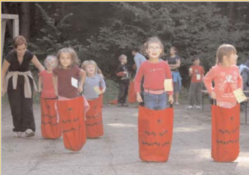
Herbst ist auch Spielzeit. Oben das Spielefest der Stadt im Pflanzgarten.

Amtliche Mitteilung der Stadtgemeinde Schwaz - Ausgabe Nr. 8, Oktober 2005