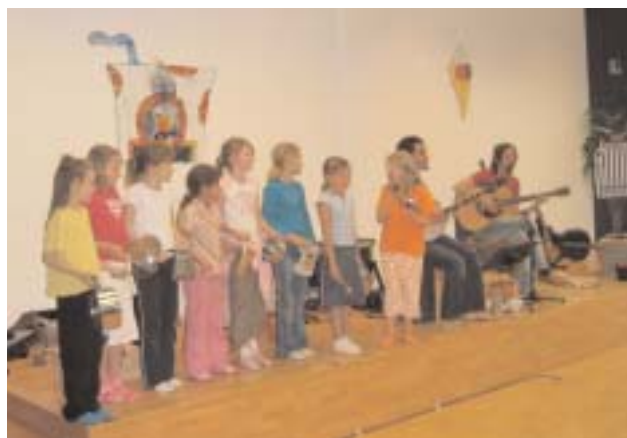
Am 17.6. hatten Klangspuren barfuß zu einem Mitmach-Konzert mit Ratz-Fatz in die Wirtschaftskammer eingeladen.

Der monatliche Sprengeltreff des Gesundheits- und Sozialsprengels Schwaz-Umgebung (am 2. Donnerstag im Monat) macht im Juli und August Sommerpause. Der nächste Sprengeltreff, an dem bei einem gemütlichen Kaffeepausch über die Angebote und Leistungen des Gesundheits- und Sozialsprengels informiert wird, findet am Donnerstag, 8. September 2005 , ab 14.30 Uhr im Seniorenheim im Postpark statt.