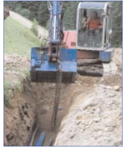
Die Quellwasserleitung am Schlingelberg wird erneuert.

Aus diesem Hochbehälter wird der Ortsteil Freundsberg versorgt. Das Überwasser geht aus dem Schmadl-Behälter in den Hauptbehälter Kraken. Im Quellgebiet am Schlingelberg bzw. Zehnerkopf können bis zu 10 l/s Trinkwasser gewonnen werden. Es handelt sich ausschließlich um Bergwasser aus alten Bergwerksstollen. Die teilweise in sehr schwierigem Gelände verlaufende Leitung bereitet seit langem aufgrund ihres Alters und der Topographie Probleme mit Leckagen und Rohrbrüchen. Die Erneuerung war daher höchst an der Zeit und wird gerade durchgeführt. Insgesamt müssen 2.600 lfm Rohr verlegt werden. Die Anlage wird so konzipiert, dass in weiterer Folge eine energetische Abarbeitung in zwei kleinen Trinkwasserkraftwerken möglich ist. Als Materialien kommen – je nach Druckbereich – Kunststoff (PEHD) und Sphäroguss mit Innenzementierung zum Einsatz. Aus der Leitung müssen auch die Anwesen am Schlingelberg mit Trinkwasser versorgt werden. Dies erfordert den Einbau von Zwischenbehältern und die Parallelführung von kleineren Versorgungsleitungen.