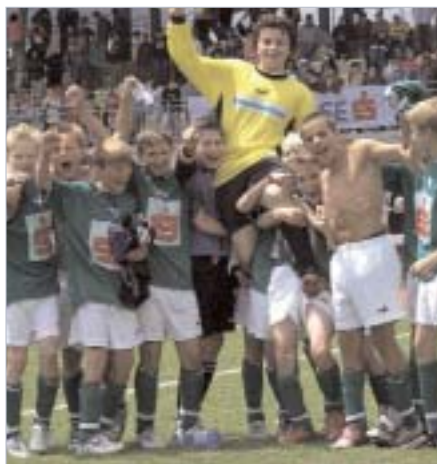
Jubel über den Schüler-Meistertitel 2005.

Die Sporthauptschule Schwaz gewann zum ersten Mal in der dreißigjährigen Geschichte der Schülerliga den Landesmeistertitel. Fünfzig Schulen haben diesmal teilgenommen. Schwaz vertritt nun Tirol beim Bundesfinale.