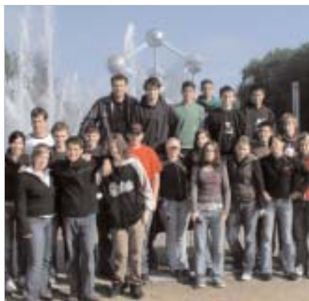
Das Team aus Schwaz vor dem Atomium.