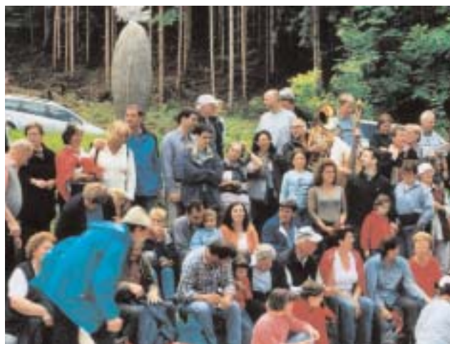
Besuch aus der Partnerstadt Tramin im Pflanzgarten.

Zum ersten Mal wird vom Städtepartnerschaftsverein von Schwaz am 3. September 2005 das Dreiländerfest der Städte Mindelheim, Tramin und Schwaz am Postpark durchgeführt. Programm: 10:30 Uhr Eröffnung, ab 11 Uhr Konzert der Knappenmusikkapelle Schwaz, 14 Uhr musikalische Unterhaltung mit der „Landhaus Combo“, 16 Uhr Aufführung des Stückes „Vater werden ist nicht schwer“ der Freilichtbühne TC Schwaz. Die Besucher erwarten kulinarische Spezialitäten aus Tramin und Mindelheim. Für Spiel und Spaß für unsere Kleinen ist gesorgt. Die Bevölkerung ist zu diesem Fest bei freiem Eintritt herzlich eingeladen.