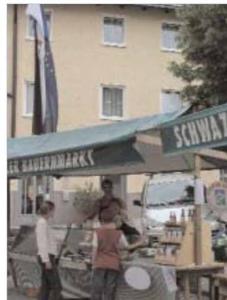
Der Schwazer Bauernmarkt am Pfundplatz.

Der Bummelzug „Silberpfeil“ verkehrt seit 1. Juni zwischen Planetarium und Franz-Josef-Straße bzw. Innenstadt, täg-