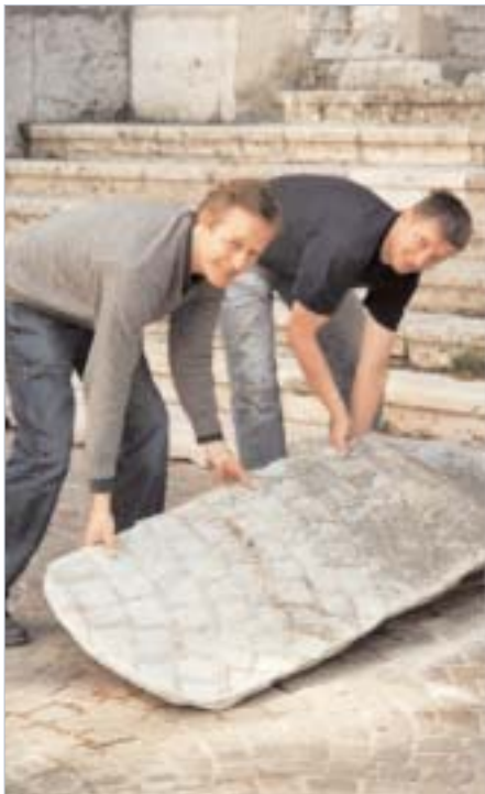
Arbeit an einem Abguss in Schwaz.